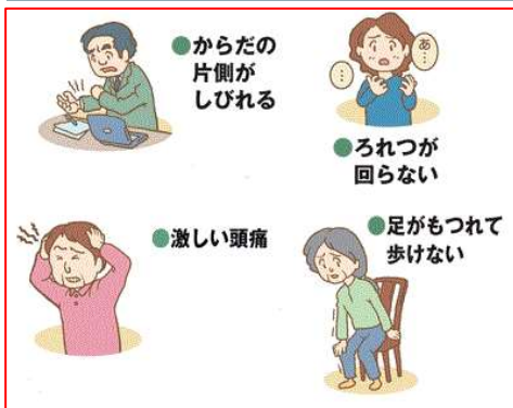
脳卒中の初期症状