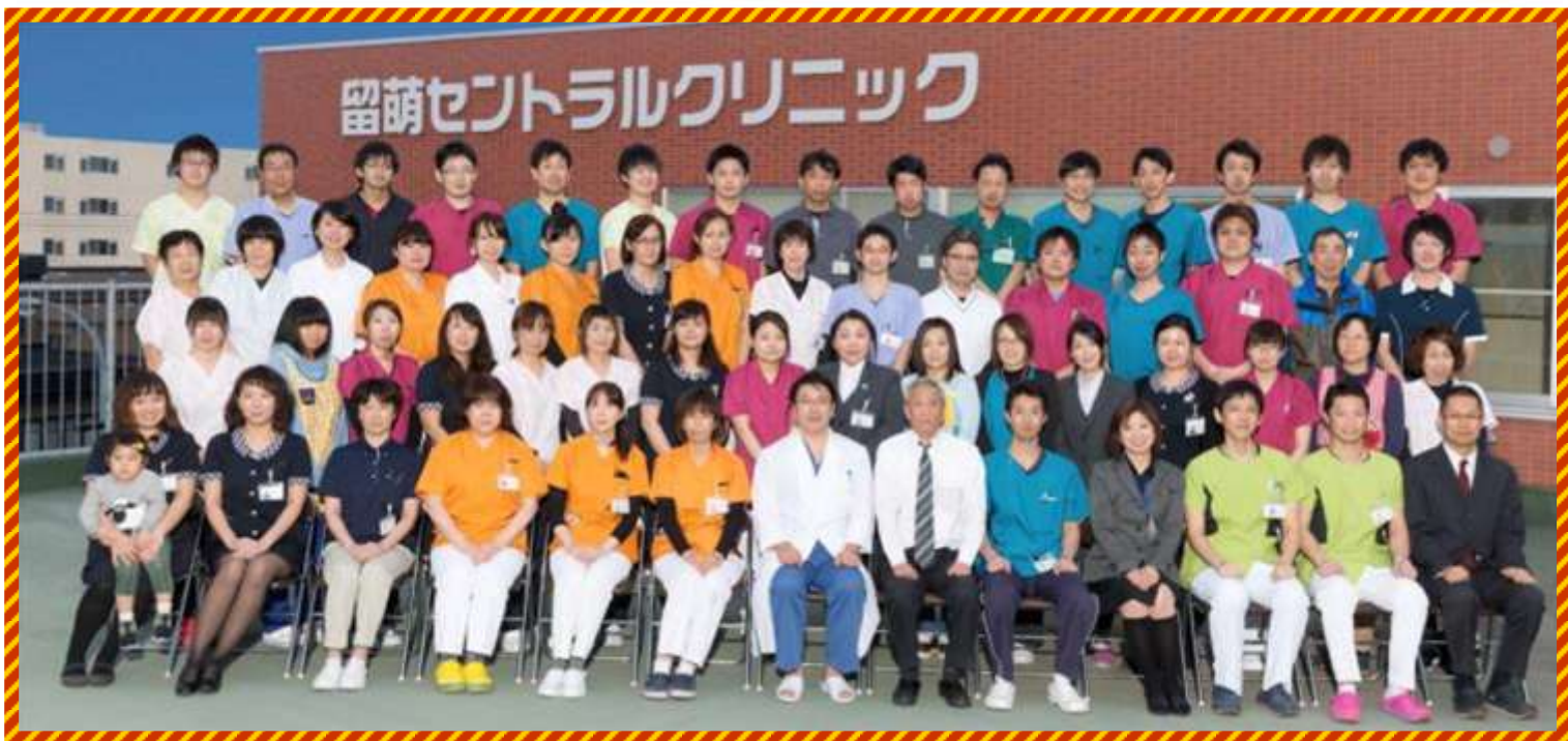
当院屋上にて撮影