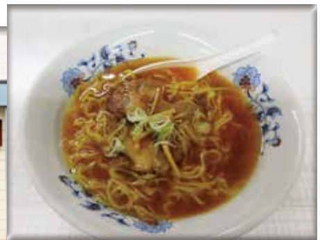
しょうゆラーメン 600 円

営業 11:00 ~ 19:00 住所 留萌市栄町 1 丁目 4-24 (留萌駅すぐ近く)