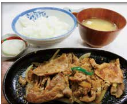
焼肉定食 800 円

わたしのお勧め老舗店、「創業 61 年 ときよし食堂」です。 昭和 33 年開業し「時が良いうちに」と名前をときよし食堂と名付けたとのこと。 お勧めは、焼肉定食です。焼肉の甘じょっぱいタレは先代奥さんが考案、現在は お嫁さんに引き継がれており、肉は熱いまま鉄板に乗せられ、店の人気 No.1 です。 ラーメンはトロトロチャーシューと懐かしい味で、つつい飲み干してしまいました。