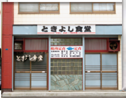
いい感じの店構え懐かしいですね