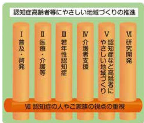
厚生労働省発行 認知症施策総合戦略（概要）より